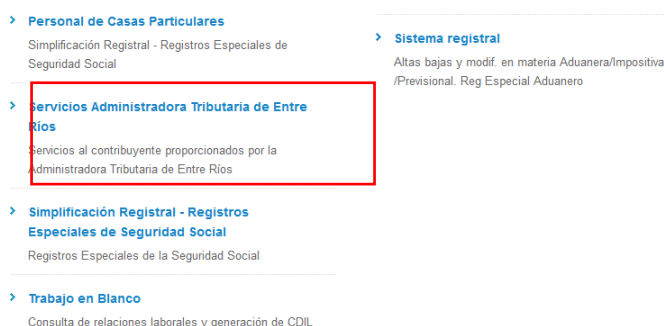
Sitio web AFIP – Servicios habilitados

Una vez identificado en el sitio de AFIP aparecerá un menú con todos los Servicios habilitados para el contribuyente, en dicho menú se debe elegir Servicios Administradora Tributaria Entre Ríos . Si usted no tiene conformada la relación de AFIP con los Servicios de la Administradora Tributaria de Entre Ríos aquí se explica cómo establecerla https://www.ater.gov.ar/noticias/fotos/instructivo%20para%20vinculacion%20con%20afip%20v5.pdf